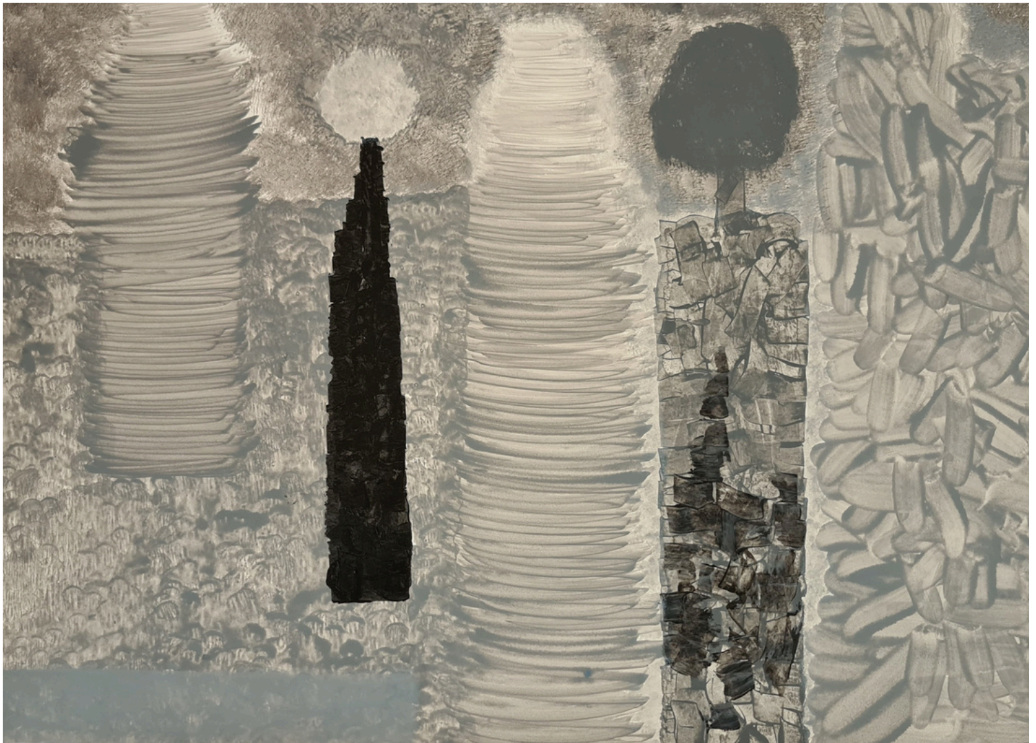
Obra de Romseneí.

Este procedimiento actual es sentir la necesidad interior de caminar entre profundas emociones espirituales, vivencias que me llevan de la mano saber mirar y saber ver con intensa emoción, hacia un preámbulo de la niñez llena de sueños, juegos y fantasía.