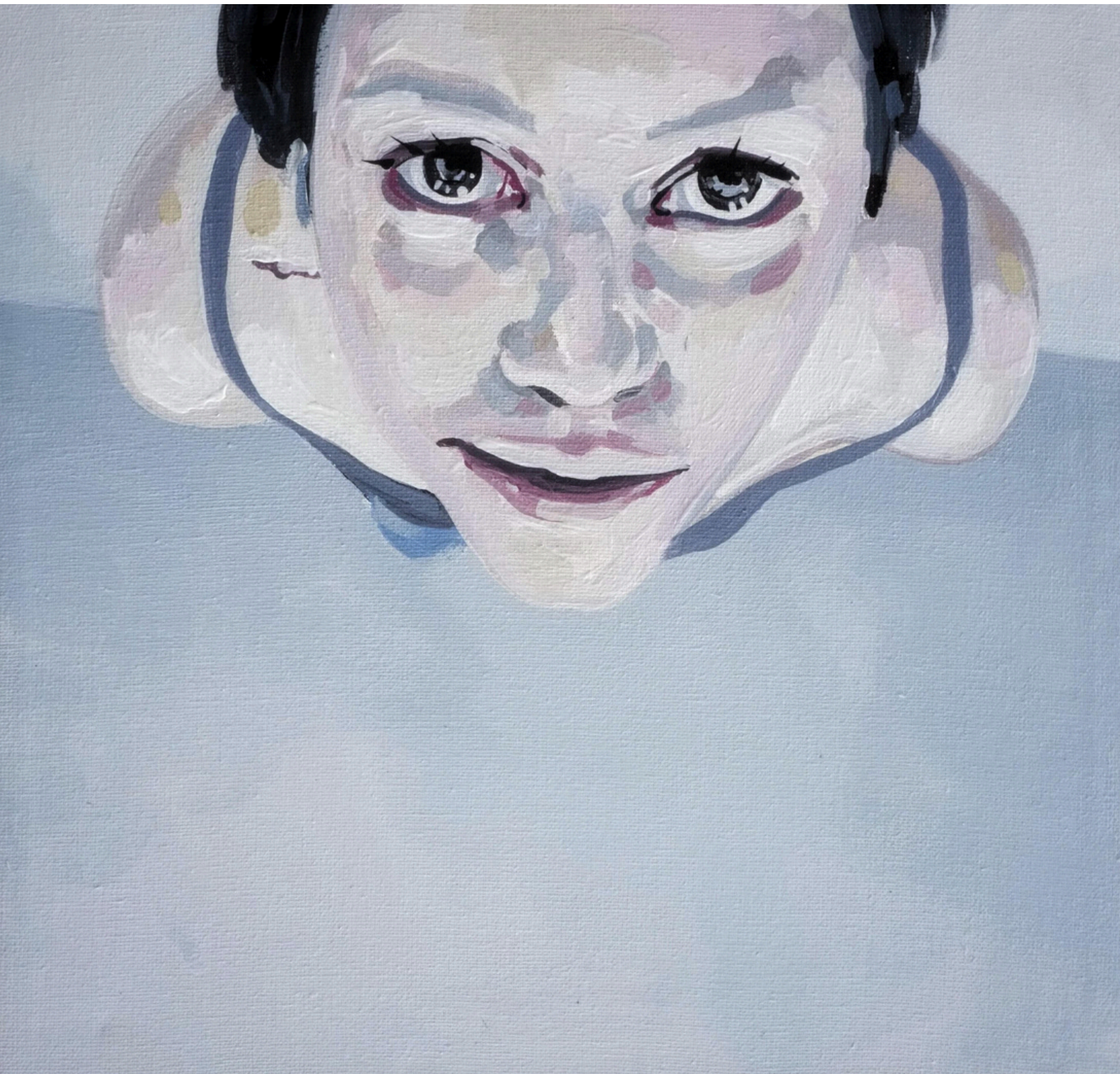
Obra de Juan Carlos Castillo.