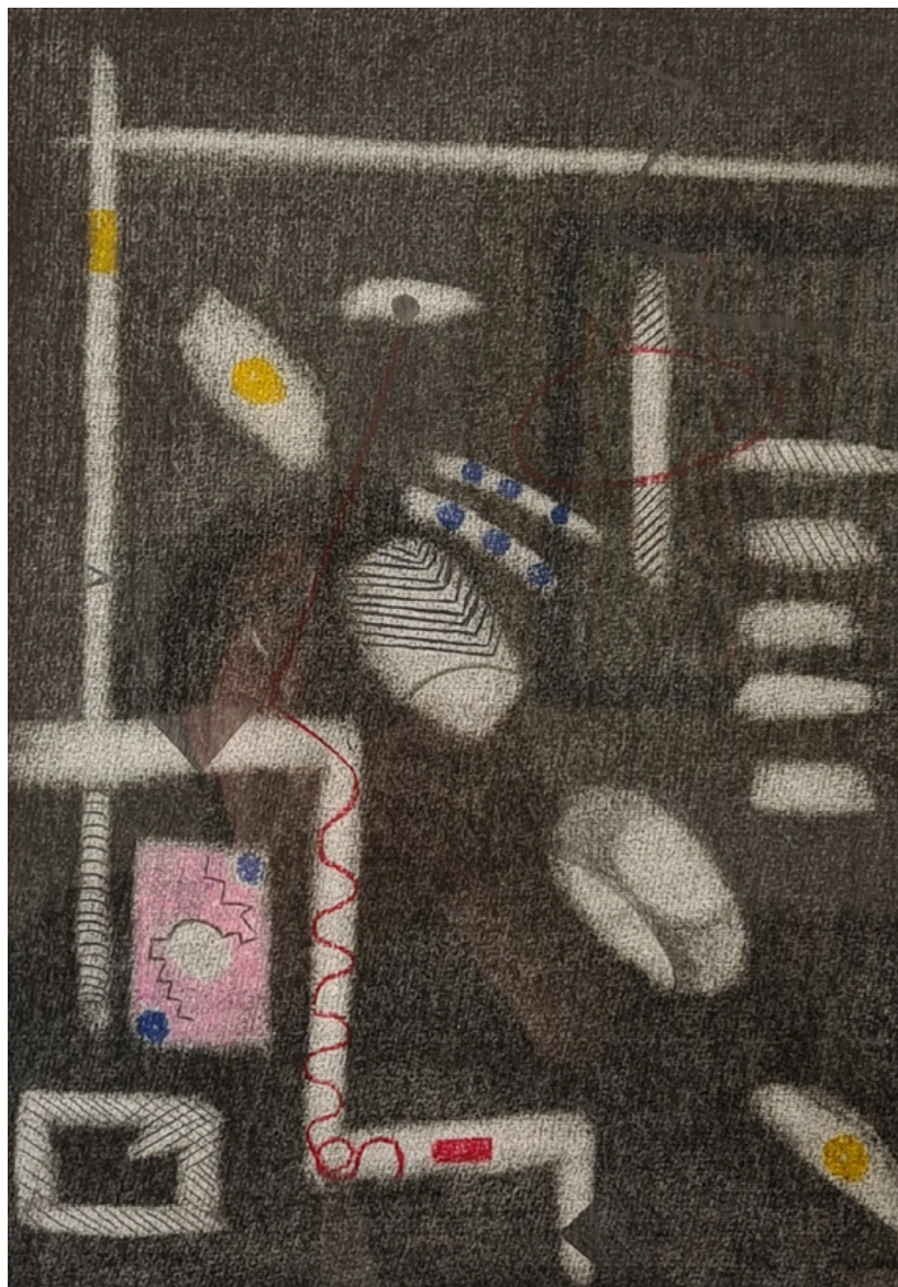
Fantasía negro 4. Técnica mixta/pastel/papel negro. Obra de Romseneí.

Me gusta afrontar el preámbulo creativo ante el blanco con una desnudez natural e improvisada. Donde la imaginación y la fantasía se nutren simultáneamente de la figuración y abstracción. Siendo esta última de rigurosas formas geométricas manifestación para mí de movimientos equilibrados, de pulcritud sin equivocación, que me llevan hacia un entusiasmo propio como energía vital de libertad.