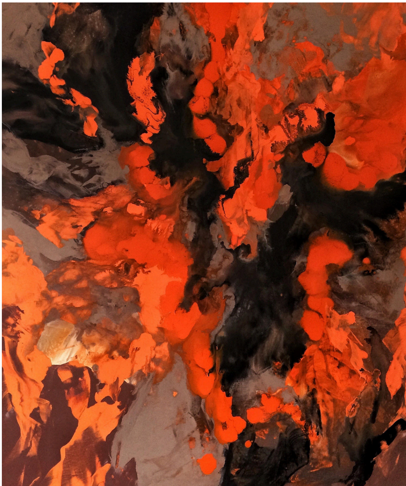
Obra de Juan Carlos Castillo.