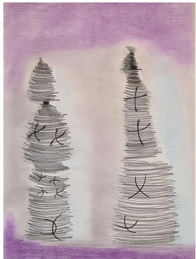
Obra de Romseneí.